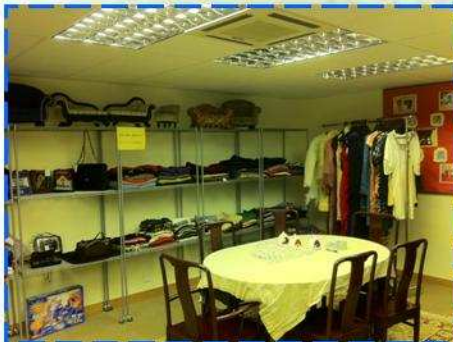
新設立的展廳用作義賣精品和二手服飾之用。