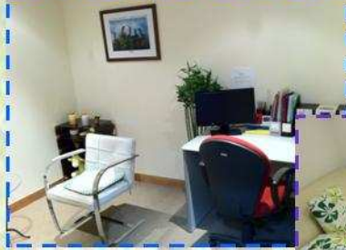
舒適的輔導室，可以調和房間燈光。