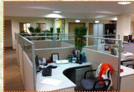
同事們辦工的地方寬闊和舒適。