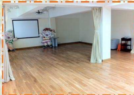
活動室用作舉辦課程及租借給其他團體使用。