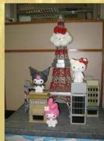
『Hello Tower 慈善塔』

*特別鳴謝『Sanrio Wave HK Company Limited』贈送出『Hello Tower 慈善塔』